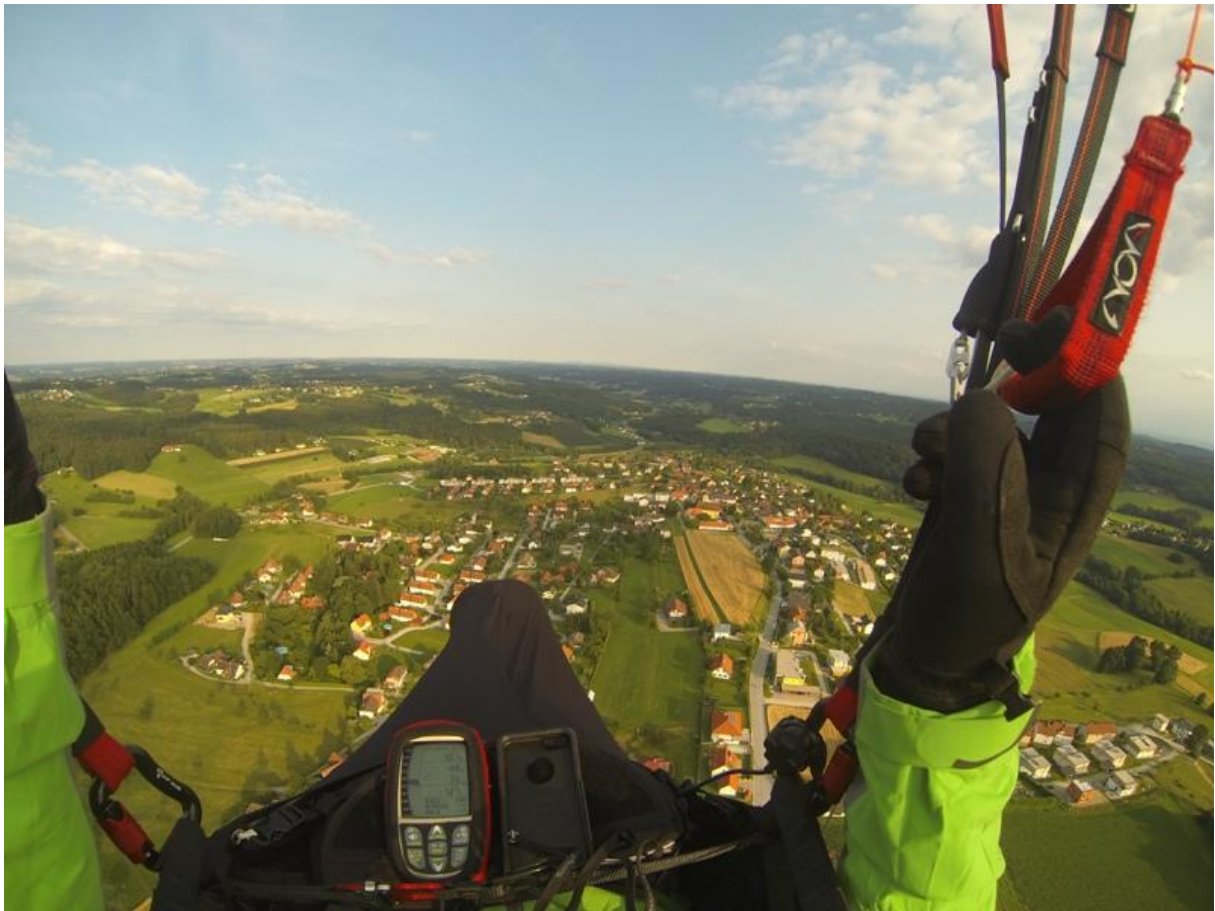
Bei den Wiesen links auf Stromleitungen achten.