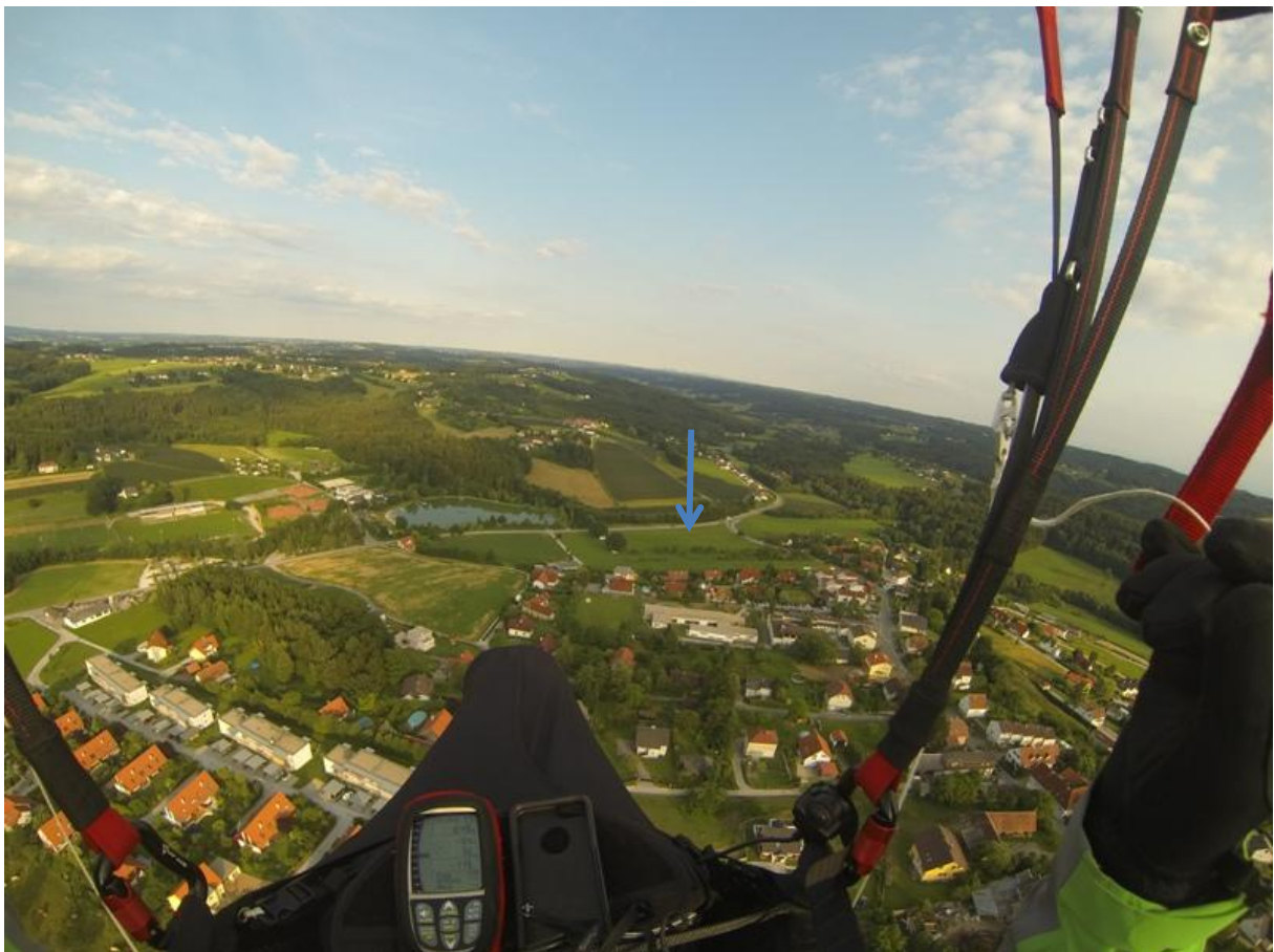
Anflug Badesees Kumberg mit Landebereich.