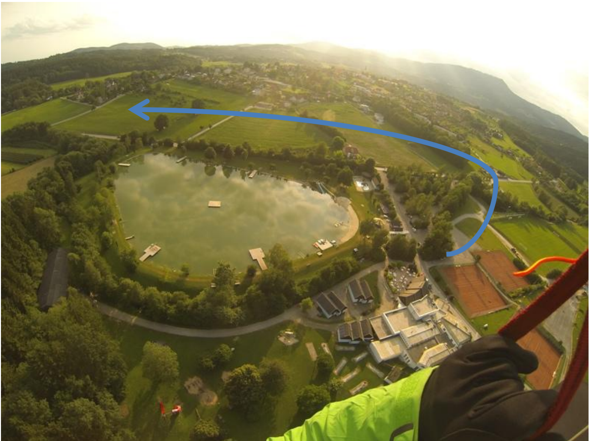
Badensee Kumberg mit dem Landebereich.