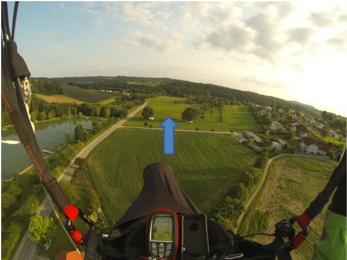
Anflug auf Landebereich