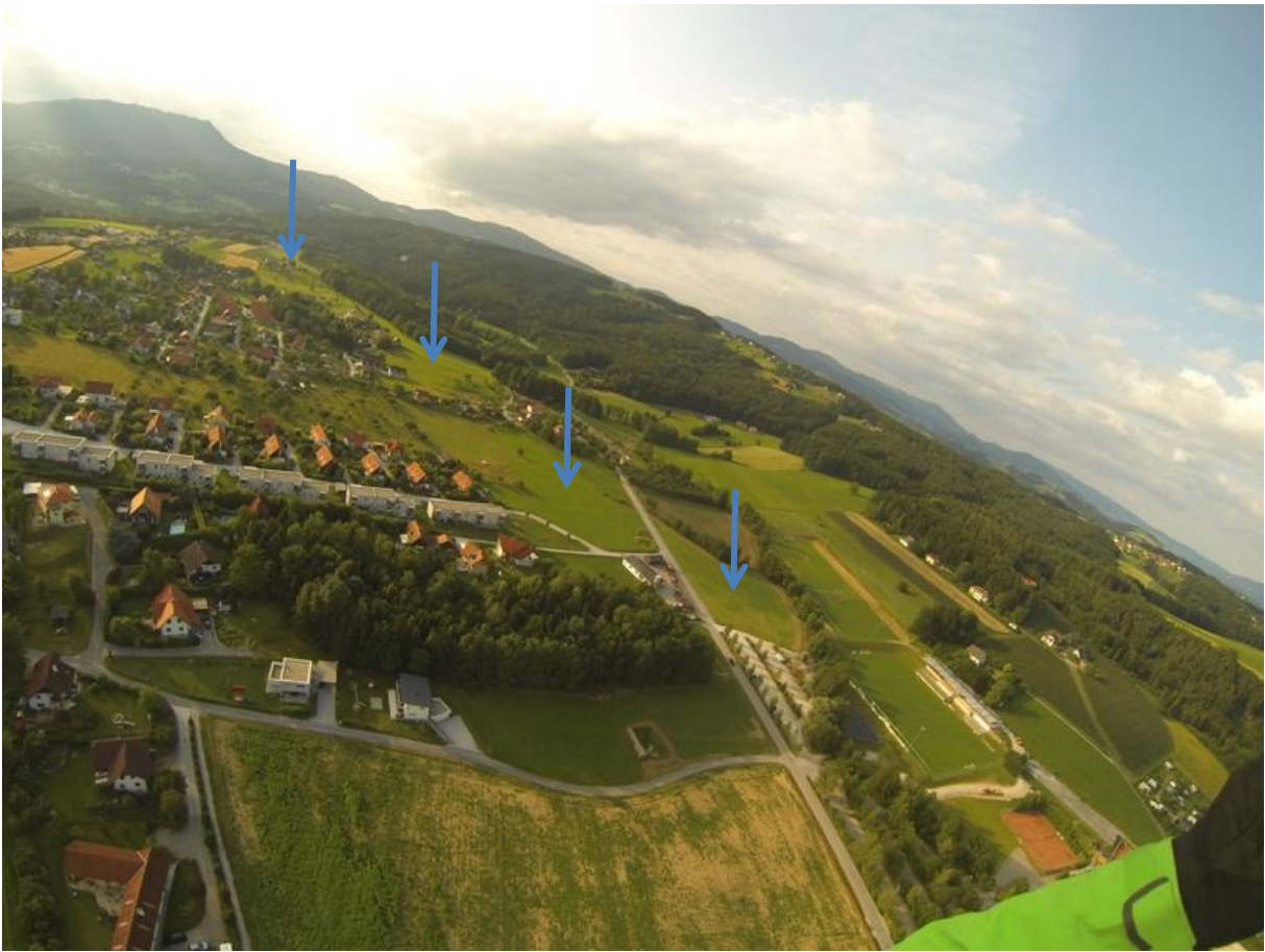
Blick zurück Richtung Startplatz Schöckl-Süd mit Landemöglichkeiten.